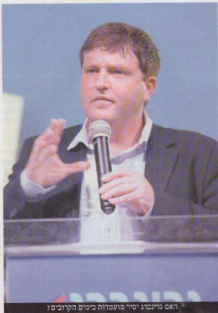
האם גרינברג יסיר מועמדות בימים הקרובים?

ועל סמך איזה בסיס? מדוע לא נחקרה הפרשה על ידי יחידה המתמחה בחקירת עבירות מין? אם מדובר בחשד לעבירת מין, מדוע לא התקיים עימות? האם נבדקה במשטרה אפשרות שמדובר בהתנכלות מצד מישהו מיריביו של גרינברג, שעומד מאחורי התלונה? כיצד מסבירה המשטרה את האינטרס להגשת התלונה? אם התלונה נפסלה על הסף, האם יש בידי המשטרה עדות מוצקה נגדית, בדמות סרטוני אבטחה או עדויות? אלה שאלות שחייבות לקבל תשובות ברורות."