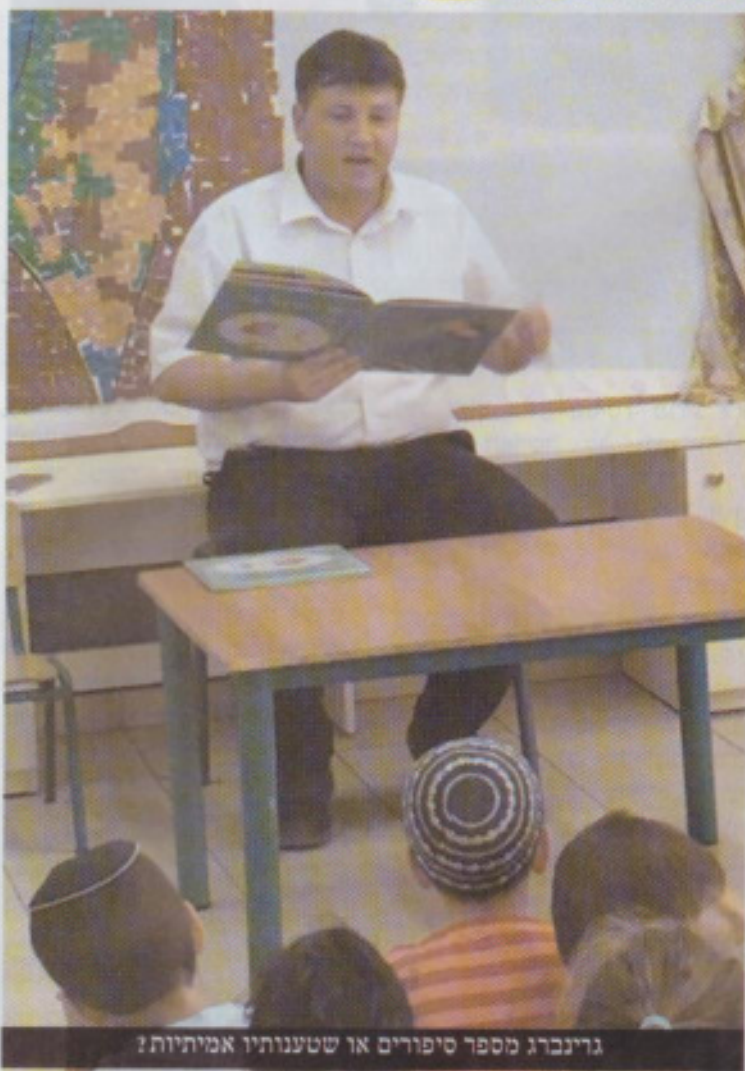
גרינברג מספר סיפורים או שטענותיו אמיתיות?

קל לי בכלל, אני בבית הרבה. אף אחד לא יבין איזה כאב יש בתוכי. מה שקרה לי הכניס אותי להלם של החיים שלי. אני מנסה לשכוח את האיש וכל מה שקשור בו. קיבלתי את הפצצה ואת הטראומה של החיים. אני מנסה לשקם את עצמי, אבל זה קשה מאוד. אני רוצה שהאמת תצא לאור, אבל בינתיים, יש לי לילות ללא שינה, מהמחשבות של איך סגרו את התיק בלי שהאמת תצא לאור. יש בני משפחה וחברים שיודעים הכל על הפרשה. לא אני ולא הם יודעים איך להתמודד עם המצב הזה. מה שקרה לי ריסק אותי לגמרי. אני מנסה לחזור לשגרה, מנסה לצאת מהבית ולחייך. אבל בסוף בלילה, הכל צף ועולה לי בחזרה. אני ממש שבר כלי. אני מאוד מאוכזב ושבור מסגירת התיק, זה אומר שכל אחד