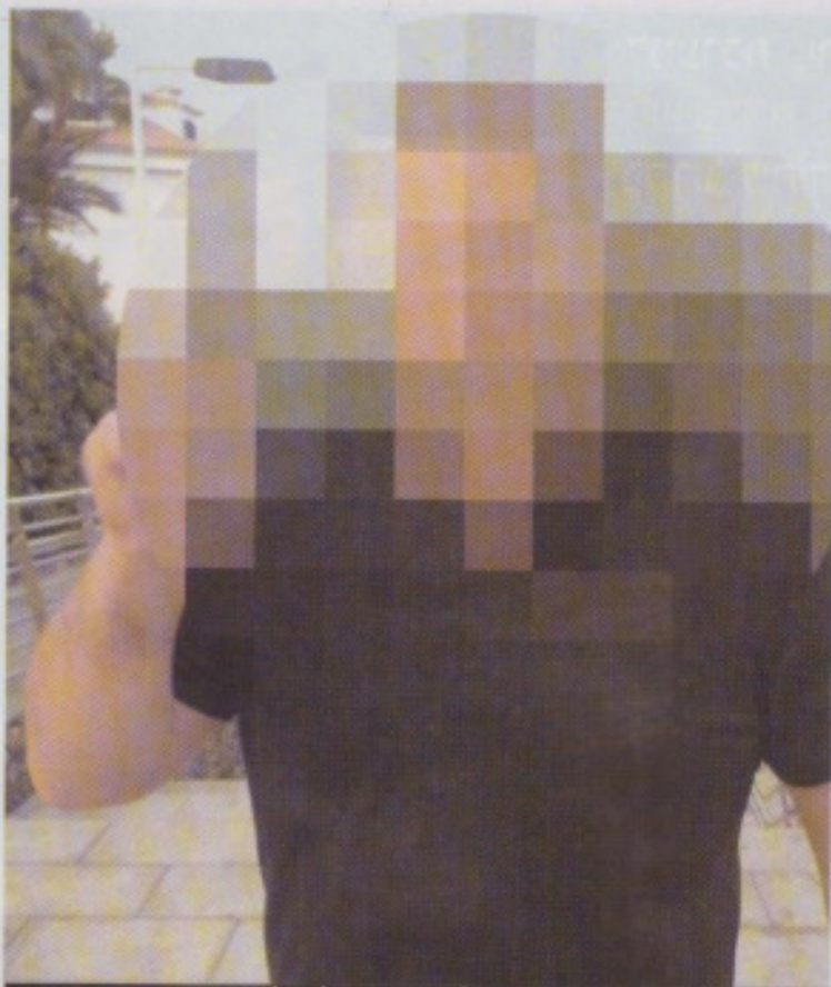
אחד האנשים הקרובים ביותר לגרינברג החליט לסייע בחשיפת הפרשה החמורה (תמונת אילוסטרציה)

פתח-תקוה. לא הייתי רוצה לראות אדם כזה מחזיק בידו תקציב של מיליארד וחצי שקל בשנה, ועושה בו ככל העולה על רוחו."