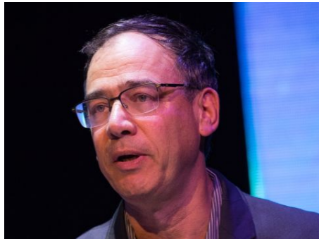
ניצן גיבוי לחוקרים

יואב יצחק • מו"ל ועורך ראשי • News1 דוא"ל • בלוג/אתר • רשימות • מעקב