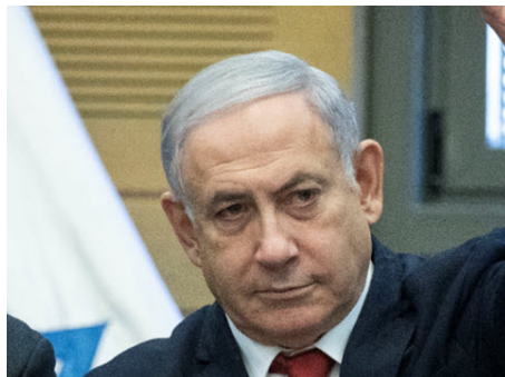
נתניהו. חפץ נסחט

ניר חפץ הוא עד מפתח בשלושת תיקי נתניהו - סחיטתו באיומים מטילה צל כבד על תוכן עדותו - שי ניצן נותן גיבוי לחוקרי המשטרה למרות שנקטו אמצעים בלתי חוקיים נגד ניר חפץ כדי לסחוט ממנו מידע ו/או הצהרות - היועמ"ש מנדלבלית הגיב שהוא לא ידע ולא אישר פעולות אלה - המידע הסנסציוני הוצג במהלך השימוע על-ידי פרקליטיו של נתניהו אך היועמ"ש נמנע עד כה מהנחיה לחקור פרשה זו