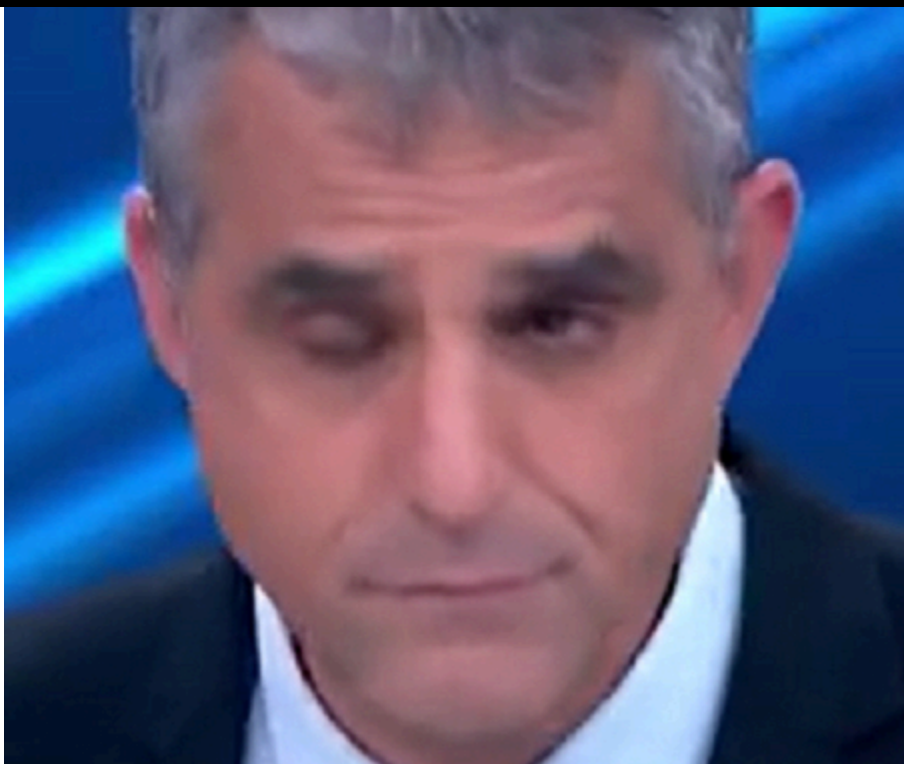
ברוך קרא ספינים וזרגים מטעמה של מלכת הנוחבה גלי בהרב מיארה